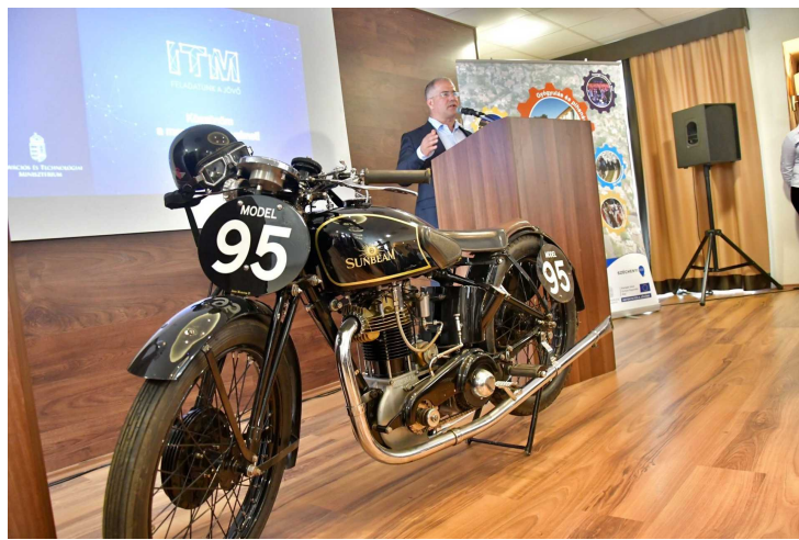
Előli motor, némileg háttérben most is Kósa Lajos

Ha fontosnak tartod, hogy a Debreciner folytathassa a munkáját, akkor támogasd! Rajtad múlik!