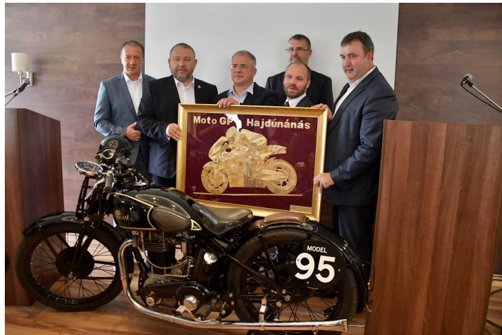
MotoGP - Hajdúnánás