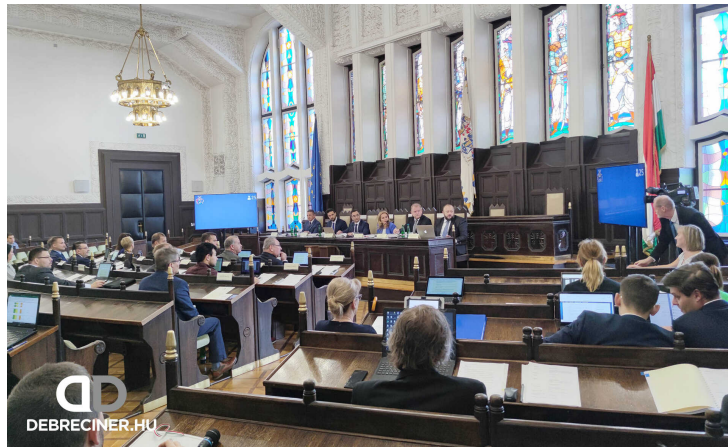
Legutóbb tavaly szeptemberben üléseztek a Megyeházán

Holnap, január 9-én reggel 9 órától a Megyeháza Árpád termében (Piac utca 54.) ülésezik Debrecen közgyűlése. Az előzetesen közzétett 9 (8 nyilvános és 1 zárt) napirendi pontból egyről, a Nagytemplom melletti üvegpiramist érintő előterjesztésről már írtunk korábban. Most bemutatunk néhány további érdekesnek ígérkező javaslatot.