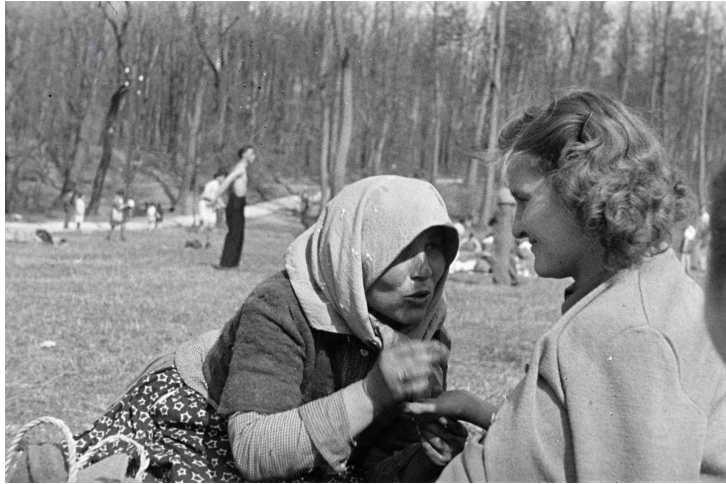
Ez a fotó 1943-ban készült

Kicserezett, barna csizmát visel, fekete szoknyát, amin sárga virágok kerülnek szét. Zöld szédzseki rajta, meg egy lila fejkendő, lovakkal és csillagokkal kihímezve. Épp a cigarettámat nyomtam el, amikor hirtelen feltűnt mellettem. Megragadta a balomat, úgy szegezte nekem a kérdéseit. Általánosságokról tudakolódzott, van-e valakim, mivel foglalkozom, hány testvérem van, ilyenekről.