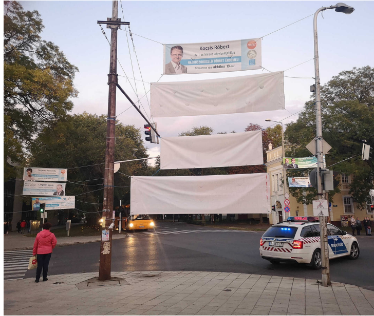
Molinósűrűség Hajdúszoboszlón