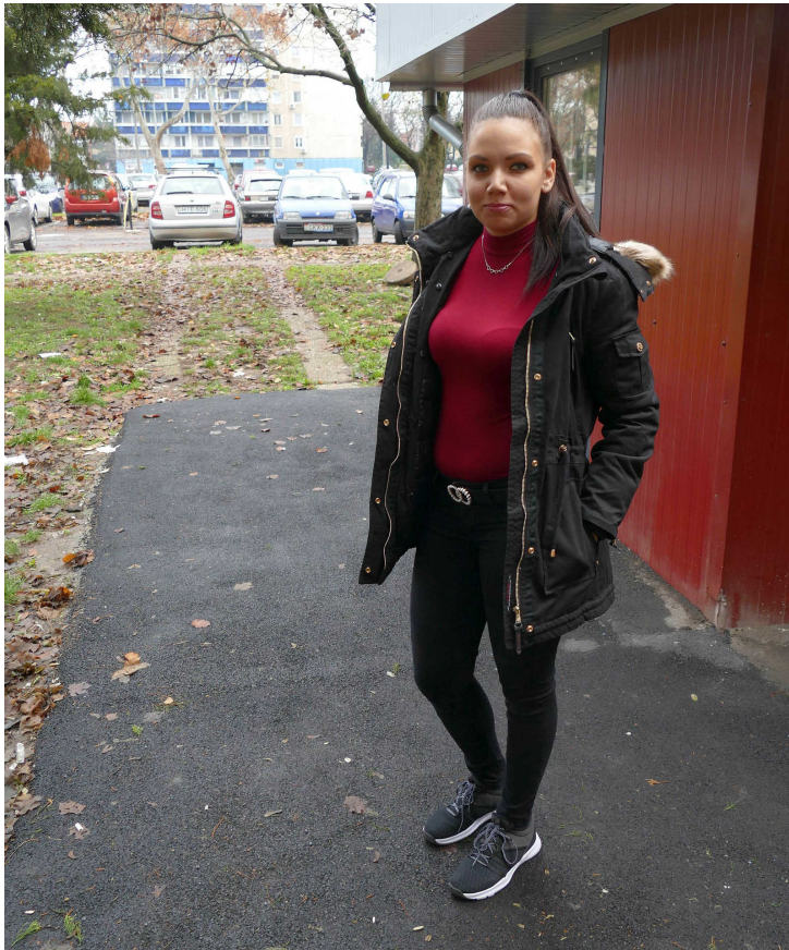
fotó: Koppányi Szabolcs

Az ARCOK DEBRECENBŐL sorozatunkban arról érdeklődünk, hogy éppen kit mi foglalkoztat.