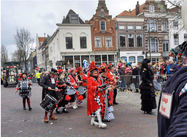
Február 22-én még felvonulás volt Zaltbommel városában