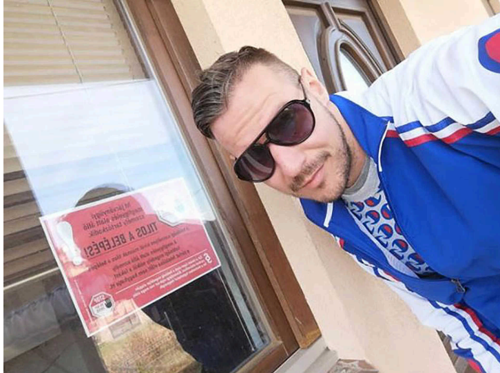
Bakó Zoltán

Hosszas vívódás után március 29-én hoztam meg végre a döntést, hogy hazatérek szülőházamba, mivel úgy értékeltem, otthon nagyobb biztonságban lehetek ezekben a bizonytalan időkben. Arról nem beszélve, hogy Angliában is napról napra változtak a különböző hírek a karantén időintervallumának tekintetében, először ugye pár hétről beszéltek, később három hónapról, de a legfrissebb információim szerint már 6-12 hónap is felmerült. Kint kaszinóban dolgoztam, a vezetőségünk is minimum fél éves szünettel kalkulált, így nem haboztam tovább, írtam egy e-mailt a londoni Magyar Nagykövetségnek, hogy haza szeretnék jutni, mit javasolnak. Egy órán belül készleges választ kaptam, a következőket tanácsolták, másolom a fontosabb részeket: