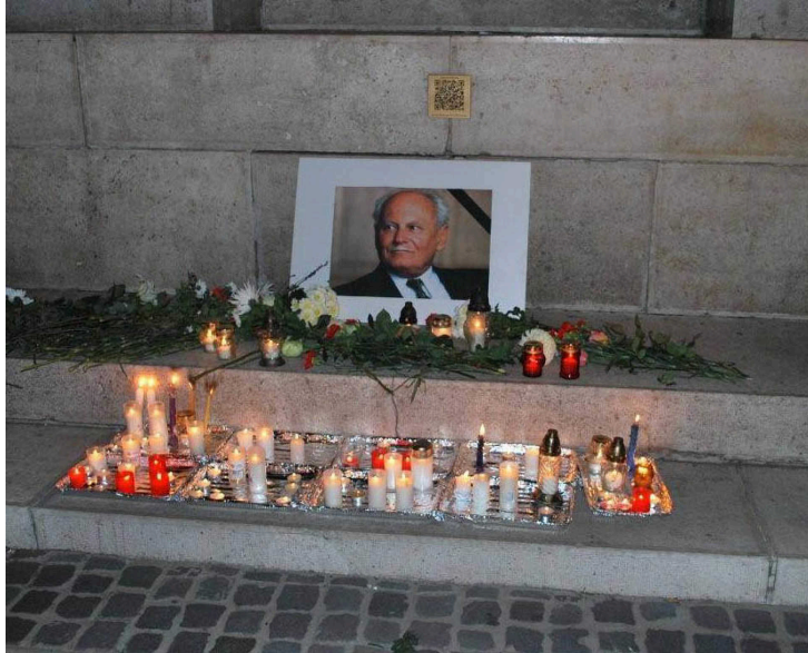
Tisztelgő debreceniek gyertyagyújtása 2015 novemberében a debreceni Kossuth-szobornál

Göncz Árpádot kétszer választotta meg az Országgyűlés köztársasági elnöknek, 1990 és 2000 között töltötte be ezt a tisztséget. 2015-ben bekövetkezett halála után a „Göncz Árpád tisztelőinek debreceni csoportja” kezdeményezte Papp László (Fidesz) polgármesternél, hogy a városban utcát vagy más közteret nevezzenek el Göncz Árpádról .