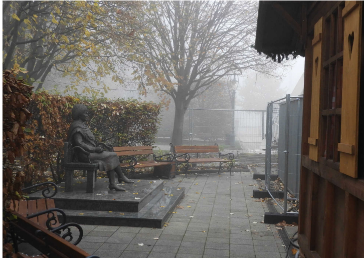
2019: Szabó Magda és a hütte hátulja

Amikor elsődleges szempont a biznysz, akkor egyszerűen eltakarják, elbarikádozzák Szabó Magda főtéri szobrát. 2019-ben egy hüttét építettek közvetlenül elé , 2020-ban pedig egy kolbászsütő bódéja került Szabó Magda szobra elé, egyenesen a moslétkos hordókra tekintett .