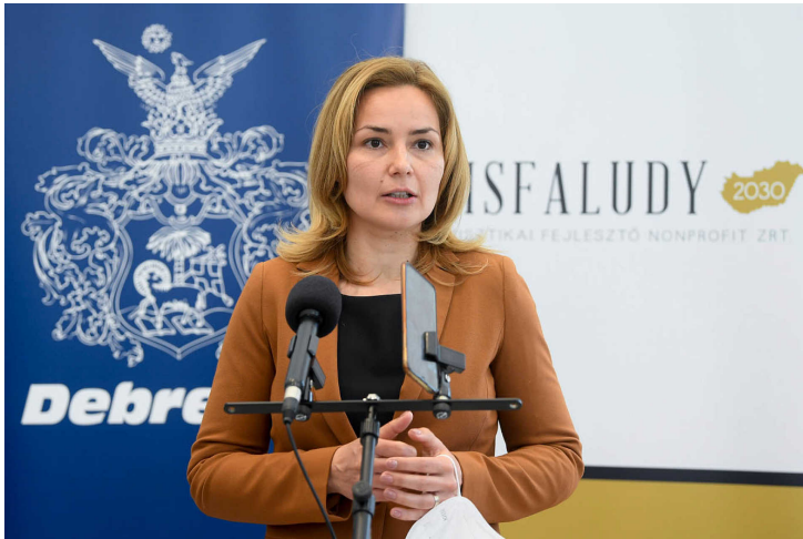
Széles Diána

Két napja Bodó Sándor (Fidesz) hajdú-bihari országgyűlési képviselő, államtitkár közösségi posztját mutattuk be . Bodó arról számolt be követőinek, hogy interjút adott a Világ gazdaságnak, ami ezzel a címmel jelent meg: Sikerült megtartani a munkahelyeket.