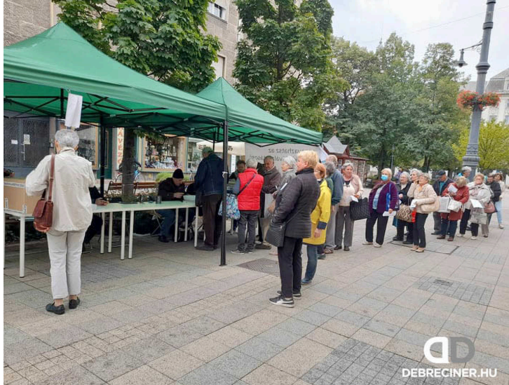
Elsőfordulós voksolás Debrecenben

Ma (október 10.) elkezdődött az ellenzéki előválasztás második fordulója, s az október 16-ai esti zárásig tart. Ahogy az első fordulóban, most is lehet szavazni személyesen szerte az országban sátrokban, illetve az interneten keresztül is.