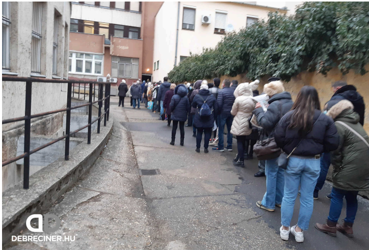
Oltásért állnak sorban Debrecenben

A vakcinaregisztráció szükségessége eddig egyáltalán nem volt egyértelmű, ami a legtöbbször hivatalos forrásból elhangzott ezzel kapcsolatban, az csupán annyi volt, hogy az igények felmérése miatt van rá szükség. A mérsékelt regisztrációs hajlandóságban vélhetően nem kis szerepe van a felmerült adatvédelmi aggályoknak, az adatok ugyanis egy Fidesz-közeli cégen futnak át, ugyanez a cég üzemelteti a választási rendszer szoftverét is.